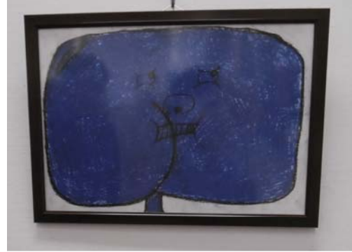
○アートシップ賞「けつまるくん」 作者のコメント「おしり。よろこんでいる顔で、色はてきとうに、青が好きだから。“まりもん”と“くりどん”（他のオリジナルキャラクター）と仲よし。」