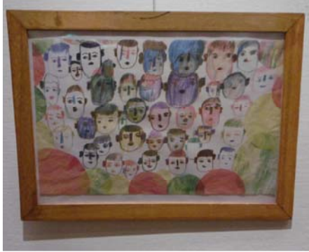
○明石文化芸術創生財団 理事長賞「顔」 あるスタッフの顔を描いてもらったのがきっかけで、そこからたくさんの「顔」が集まりました。

昨年の12月、明石市立文化博物館で開かれたアートシップ明石に出展しました。アートシップ明石とは障がいのある方の作品展で、アートを通して障害の有無に関係のない、ユニバーサルな社会を目指すものです。作業療法を行っている患者さん14名の方が出展されました。さらにプログラムとして、会場へ、自分の作品が展示されている様子を見に行きました。患者様のやる気や自信に繋がる機会となりました。そのうち2名の作品が素晴らしい賞を受賞しましたので、今回はその作品を紹介します。